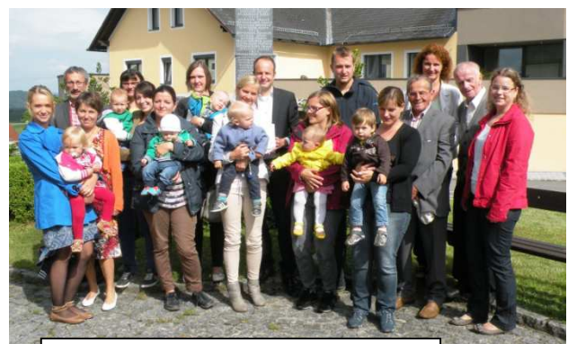
Arbeitskreis Caritas u. Begegnung Kindersegnung