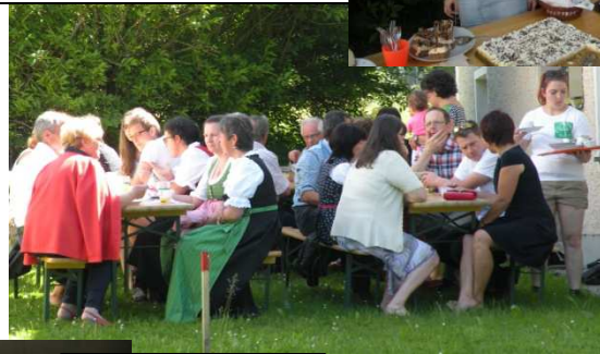
Vatertagskaffee der JS