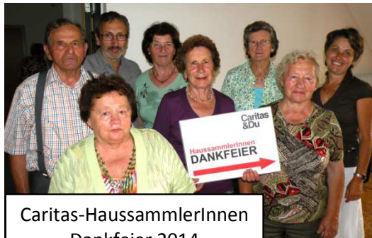
Caritas-HaussammlerInnen Dankfeier 2014