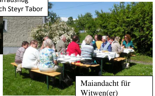
Maiandacht für Witwen(er)