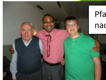
Pfarrerausflug nach Steyr Tabor