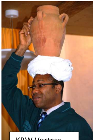
KBW Vortrag in der Hoamat